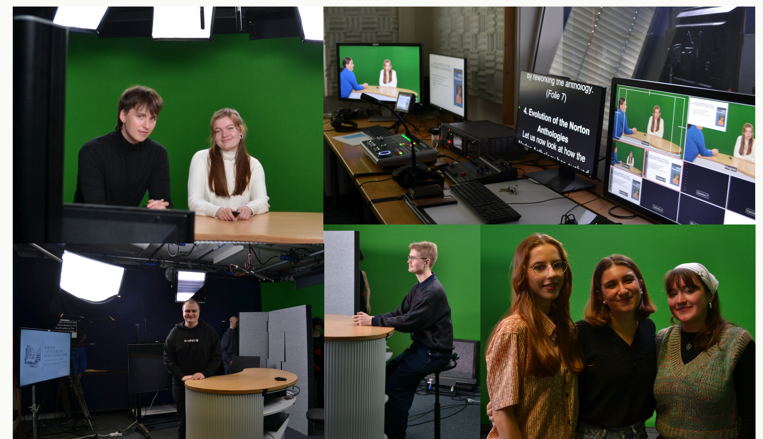
Abbildung 4; Aufnahmen im Tonstudio

Ziel unseres Projekts waren unter anderem E-Learning Einheiten, die in unserem Studiengang fortlaufend zur Verfügung stehen. Dafür haben wir unsere Ergebnisse zusammengefasst, in Skripte und Präsentationen festgehalten und schließlich die E-Learning Einheiten aufgenommen.