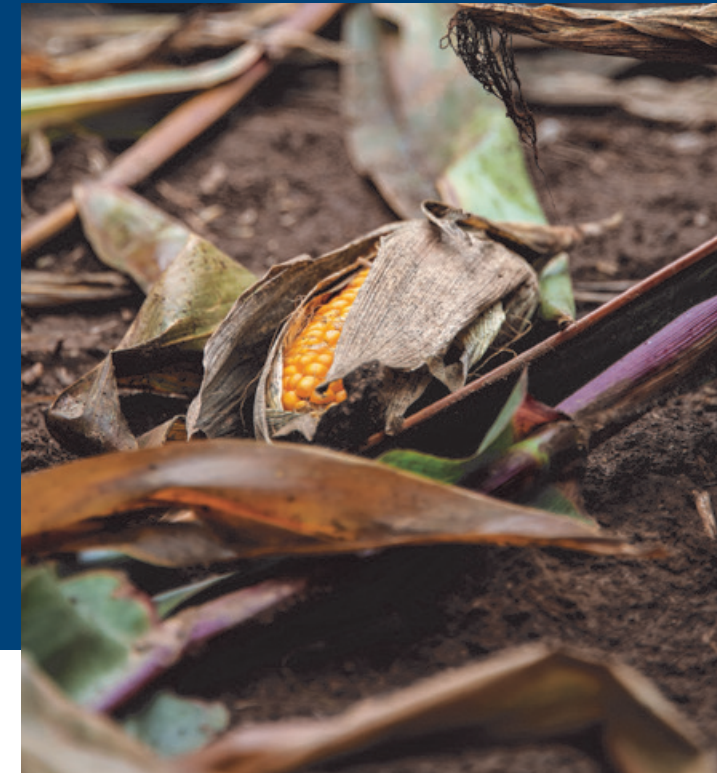
Layout: Querblick | Stand: Oktober 2019

15. – 16. NOVEMBER 2019 UNIVERSITÄT GÖTTINGEN