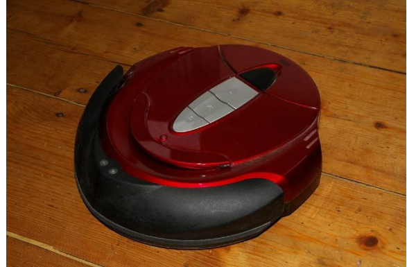
Abbildung 1: Reinigungsroboter

Aufgabe 2: Beim Staubsaugen wird schon mal der ein oder andere Legobaustein oder anderes kleines Spielzeug aufgesaugt. Hilfreich wäre daher ein Warnsystem, dass das Saugen unterbricht und ein Warnsignal auslöst, wenn der Roboter ein Spielzeug findet.